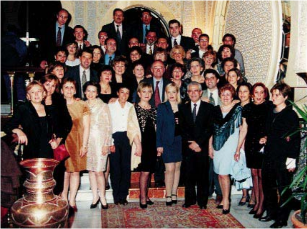
Grupo de Enfermeras, Auxiliares, Secretarias y Médicos relacionados a lo largo del tiempo con el Servicio de Urología. Cena de clausura del XXV Aniversario.

Andaluz de Salud, Programa Feder, Fondo de Investigaciones Sanitarias del Ministerio de Sanidad y Consumo) y Fundaciones (Fundación para la Investigación en Urología, Fundación Virgen de las Nieves), en relación con la detección de alteraciones en la expresión de antígenos H. L. A., mecanismos moleculares y sus implicaciones en la carcinogénesis de cáncer de próstata, vejiga y riñón, así como en relación con el estudio de los factores pronósticos en la respuesta a la inmunoterapia del cáncer renal diseminado.