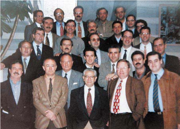
Commemorando el XX Aniversario del Servicio.