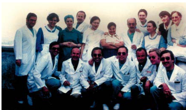
Médicos y Enfermeras del Servicio en Octubre de 1977.