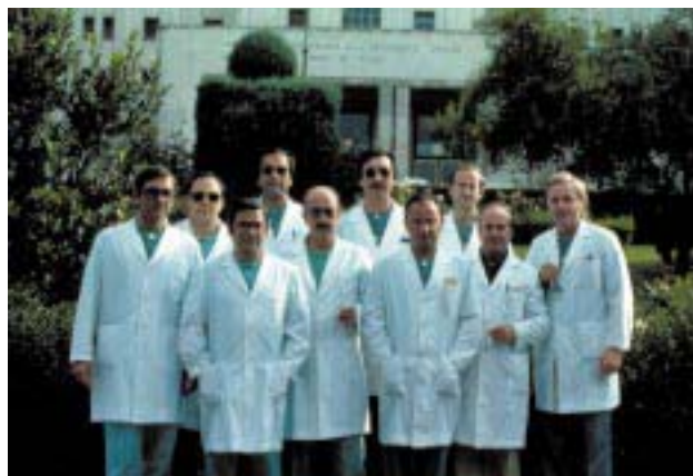
Algunos componentes del Servicio en 1977

Como ya se ha dicho en septiembre de 1982 se produce el retorno a las nuevas instalaciones del Hospital Ruiz de Alda, como parte integrante de la Ciudad Sanitaria Virgen de las Nieves, ocupando, de nuevo, la planta sexta en cuanto a su área de hospita-