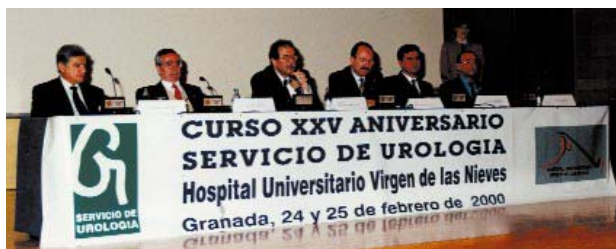
Mesa presidencial del Acto inaugural.