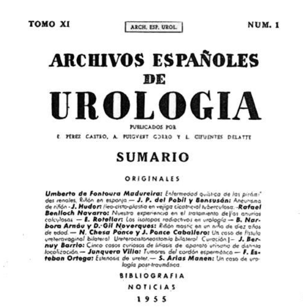
FIGURA 2. Portada de Archivos Españoles de Urología (Madrid, 1944). Revista donde publicó gran parte de su obra.

Obtuvo la medalla al mérito azul de la seguridad social en el año 1971.