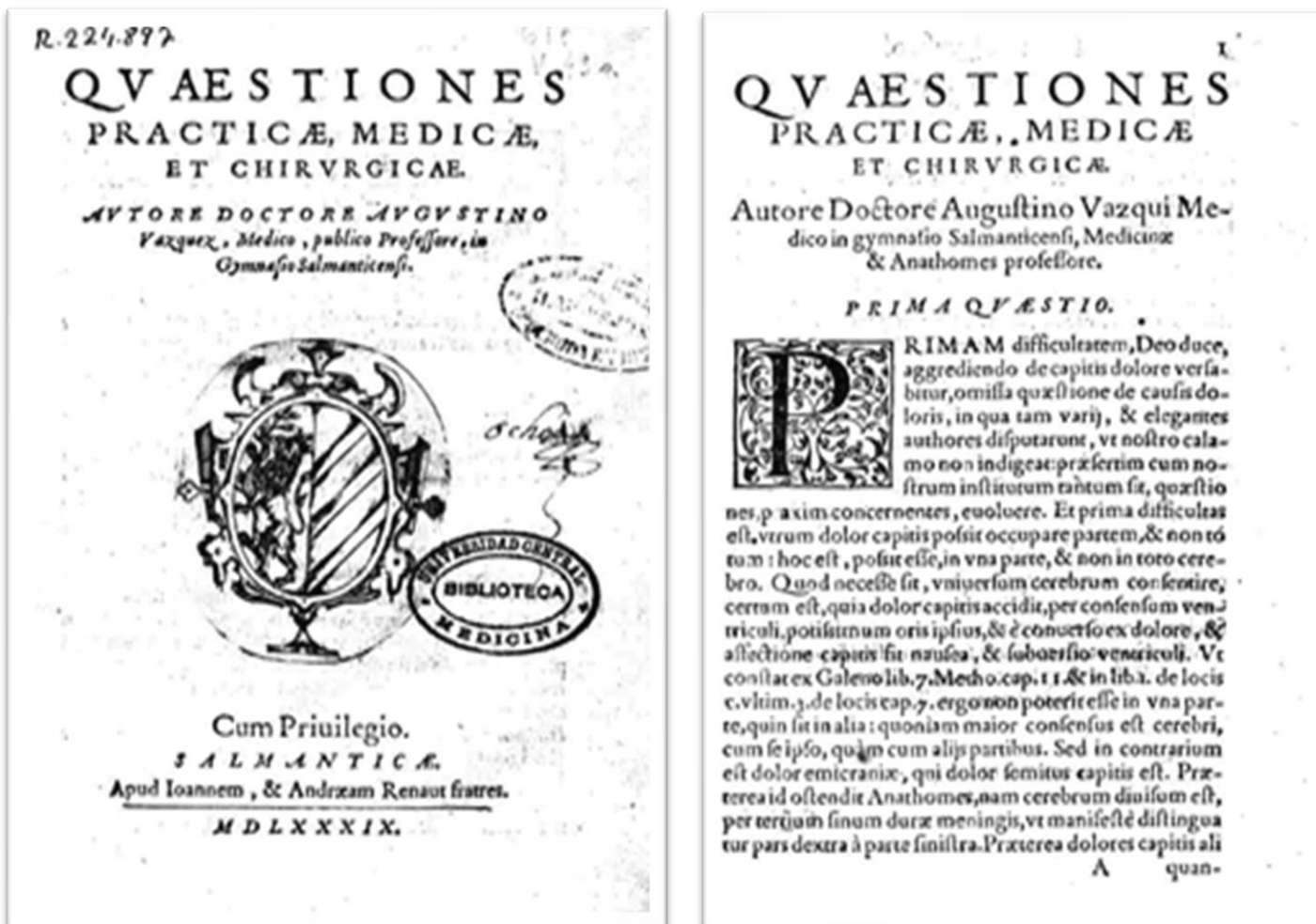
Figura 1. Quaestiones Practicae, Medicae et Chirurgicae.